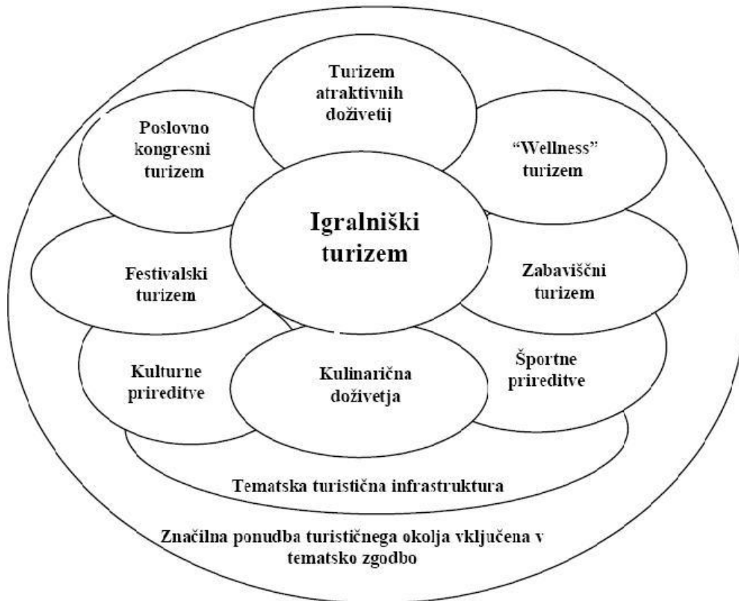
Slika 1: Prikaz povezanosti različnih ponudb v celovito zgodbo igralniško zabavišnega resorta