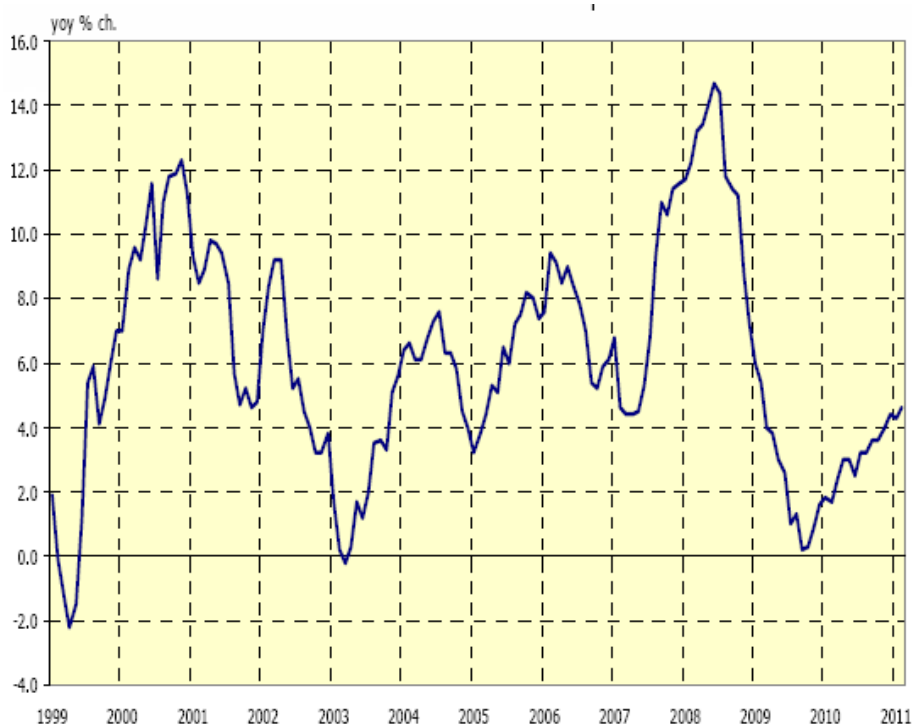
Slika 4: Inflacija HICP v obdobju 1999-2011

Vir: National statistical institute, Key indicators for Bulgaria, 2011b , str. 7.