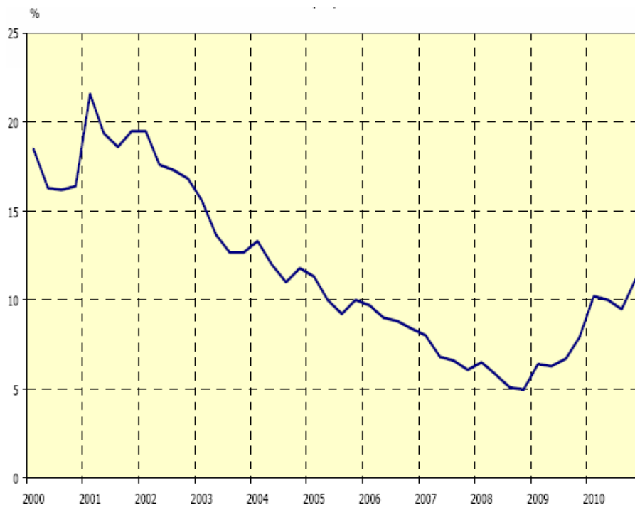
Slika 3: Gibanje brezposelnosti v obdobju 2000-2011

Vir: National statistical institute, Key indicators for Bulgaria, 2011b, str. 5.