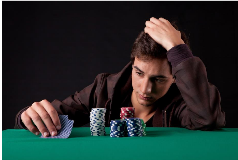
Slika 1: Znaki in simptomi odvisnosti od igralnštva