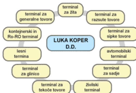
Slika 1: Organiziranost podjetja Luka Koper