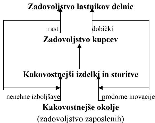
Slika 2: Dinamični odnosi med interesnimi skupinami v zelo uspešnem podjetju

Interesne skupine se dinamično povezujejo, kar je vidno iz slike 2. Vsako napredno podjetje ustvari visoko stopnjo zadovoljstva pri zaposlenih, ker ve, da bodo potem rajši delali na področju izboljšav, inovacij in na splošno. Rezultat tega so izdelki in storitve, ki so kakovostnejši in prenesejo več zadovoljstva kupcem. Kupčevo zadovoljstvo se odraža v ponovnih nakupih. S prodajo prideta višja rast in dobiček, ki prinašata več zadovoljstva delničarjem. Ta proces se vrne na začetek in omogoči še kakovostnejše okolje za zaposlene.