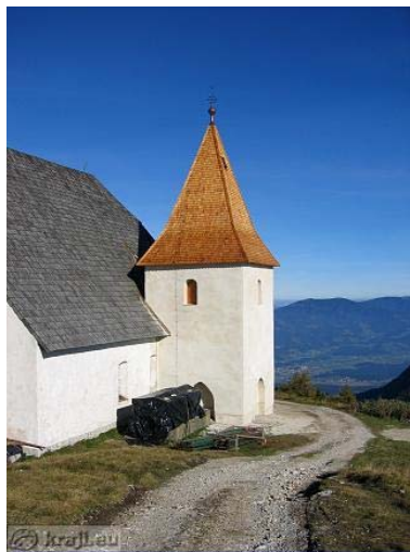
Slika 3: Najvišja cerkev na Slovenskem, Uršlja gora