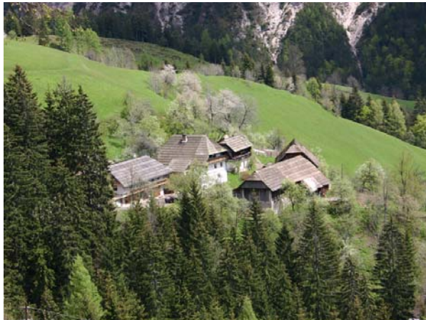
Slika 4: Celk, samotna kmetija