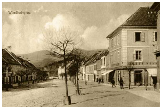
Slika 1: Slovenj Gradec nekoč