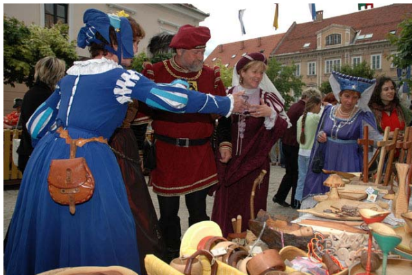
Slika 5: Srednjeveški dan v Slovenj Gradcu