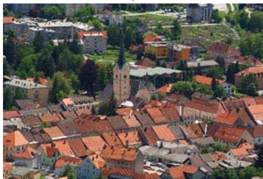
Slika 2: Slovenj Gradec danes