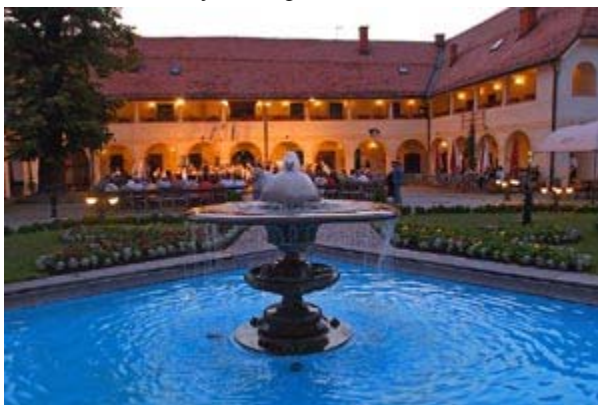
Slika 6: Graščina Roteturn, kjer ima prostore Mestna občina Slovenj Gradec