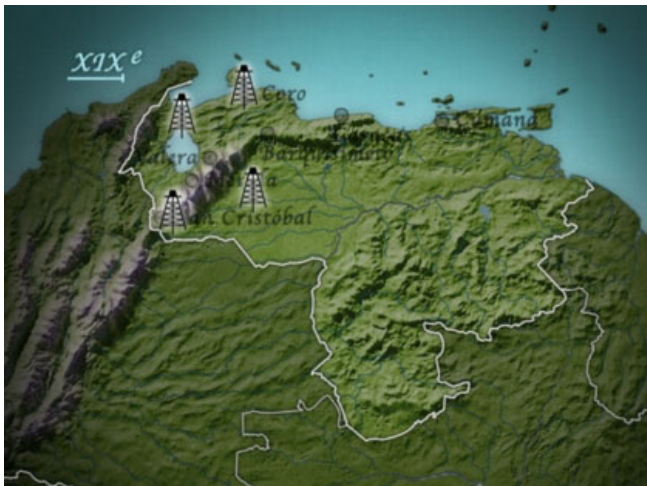
Slika 2: Naftna nahajališča Venezuele

Venezuela je bila kolonizirana od leta 1520 in prva mesta so nastala prav na obali in v Andih. V 19. stoletju so na zahodu Venezuele odkrili nafto, ki je postala pogonska sila razvoja gospodarstva, hkrati je korenito spremenila državo. Sprva so nafto črpala britanska, nizozemska in ameriška podjetja. Država je začela sodelovati pri izkoriščanju šele leta 1946, ko je začela terjati del prihodkov od črpanja. Do velikega premika je prišlo leta 1975, ko je država nacionalizirala naftna polja in ustanovila podjetje Petroleos de Venezuela. Od tistega časa predstavlja nafta 30% BDP. Posledica tega so bile investicije v infrastrukturo, kmetijstvo in industrijo. Med leti 1930 in 1980 je Venezuela dosegala v povprečju 7 % gospodarsko rast. Čeprav še vedno obstaja relativno velika razlika med socialnimi sloji, le ta ni tako radikalna kot v drugih državah Latinske Amerike (Wikipedia, 2007).