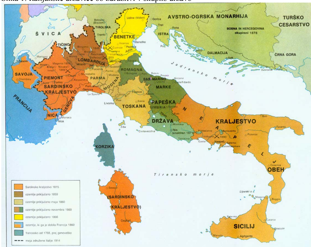
Slika 1: Italijanske državnice ob združitvi v skupno državo