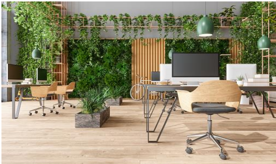
Slika 1: Primer zelene pisarne

načinov za zmanjšanje negativnega vpliva pisarne na okolje. Slovenska organizacija Umanotera (brez datuma) je leta 2011 začela s triletnim projektom Evropska zelena pisarna (angl. izraz – EGO) s še šestimi partnerji iz različnih držav članic. Glavni cilj je bil razviti standardizirane smernice, po katerih lahko podjetja preoblikujejo svoje pisarne, da ustvarijo okolju in človeku prijazen prostor (Povodor in drugi, 2013). Evropska unija si še naprej zelo prizadeva za sprejemanje zakonov in projektov za pomoč državam pri ohranjanju okolja, vendar brez učinkovitega izvajanja varstvo okolja ne more biti uspešno. Primer zelene pisarne je predstavljen na sliki 1.