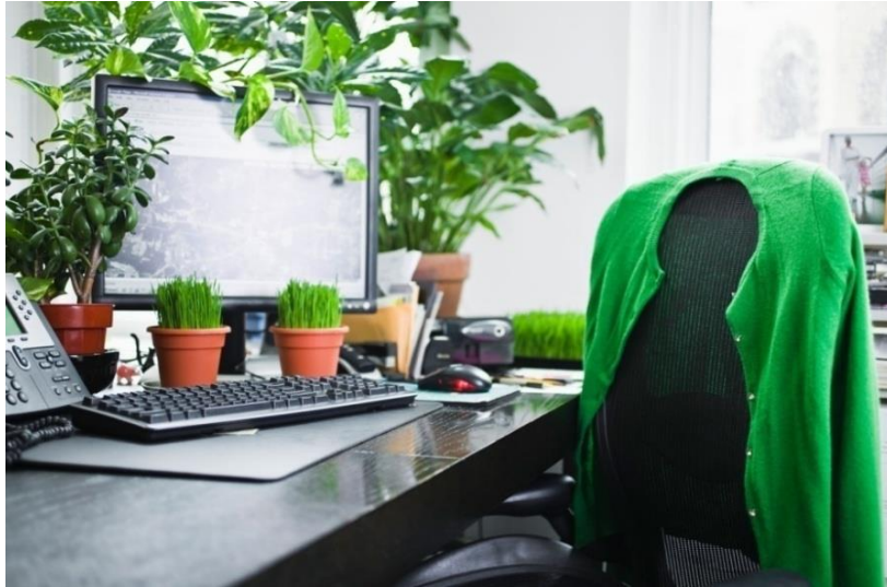
Slika 3: Primer rastlin v pisarni

in vlažnost zraka. Temperatura mora biti pozimi med 19 °C in 21 °C ter med 23 °C in 26 °C poleti, vlažnost zraka mora biti med 40 % in 60 %. Primer pisarne, ki je okrašena z rastlinami je prikazan na sliki 3 .