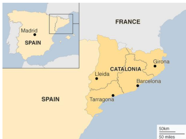
Slika 1: Zemljevid Katalonije

Katalonija je avtonomna skupnost v Španiji, ki leži na severovzhodnem delu Iberskega polotoka. Sestavljajo jo štiri pokrajine, in sicer Barcelona, Girona, Lleida in Tarragona. Glavno mesto Katalonije, ki je hkrati tudi največje mesto, je Barcelona, ki je tudi drugo največje mesto Kraljevine Španije in šesto najbolj naseljeno območje v Evropski uniji. V Kataloniji trenutno živi nekaj več kot 7,5 milijona prebivalcev. Nahaja se na ozemlju, ki je veliko nekaj več kot 32.000 kvadratnih kilometrov. Katalonija je po španski ustavi označena kot avtonomna skupnost, kar pomeni, da pravico do samouprave, torej ima svoje zakone, vlado, volitve in tako dalje, mora pa delovati v skladu z ustavo Kraljevine Španije ter drugim najvišjim pravnim aktom v Kraljevini, statutom o avtonomiji. Drugače Katalonija meji na Francijo in Andoro na severu. Na vzhodu države se nahaja sredozemsko morje, na zahodu španska avtonomna skupnost Aragon in Valencija na jugu. Uradni jeziki v Kataloniji so španščina, arabščina in katalonščina, ki v zadnjih letih pridobiva vse večji pomen zaradi povečanega nacionalizma in promocije katalonskega jezika v svetu (Catalonia, 2019a).