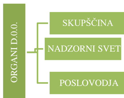
Slika 1: Organi družbe z omejeno odgovornostjo