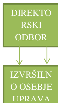
Slika 4: enotirno korporacijsko upravljanje