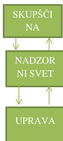
Slika 5: Dvotirno korporacijsko upravljanje