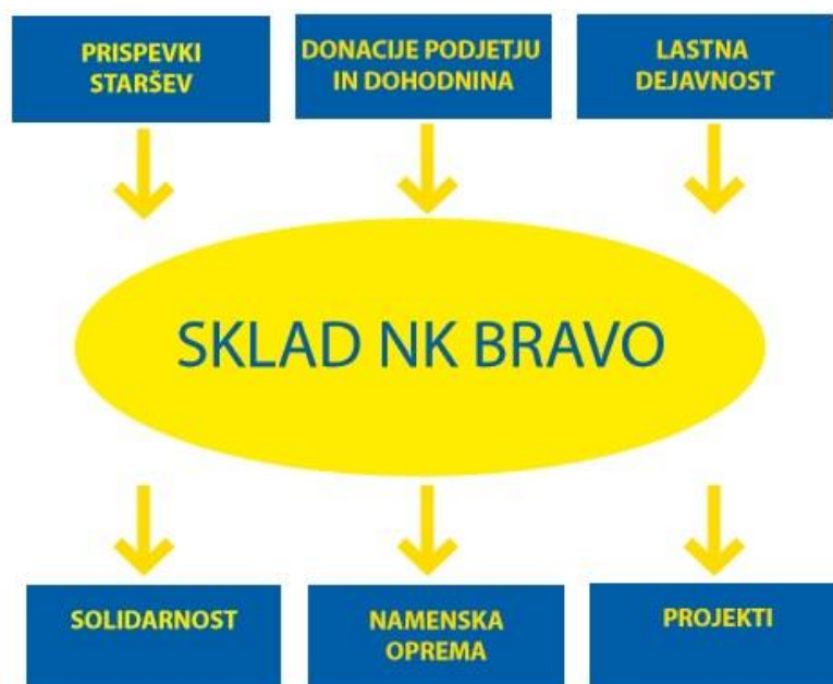
Slika 4: Prikaz prispevkov in namena odhodkov, sklada NK Bravo