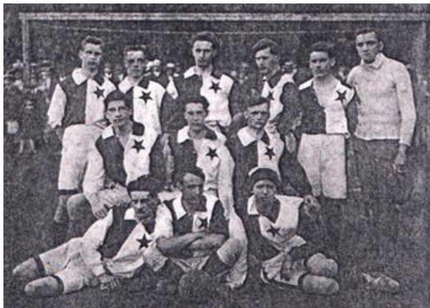
Slika 1: Dijaški nogometni klub Hermes iz Ljubljane (1910)