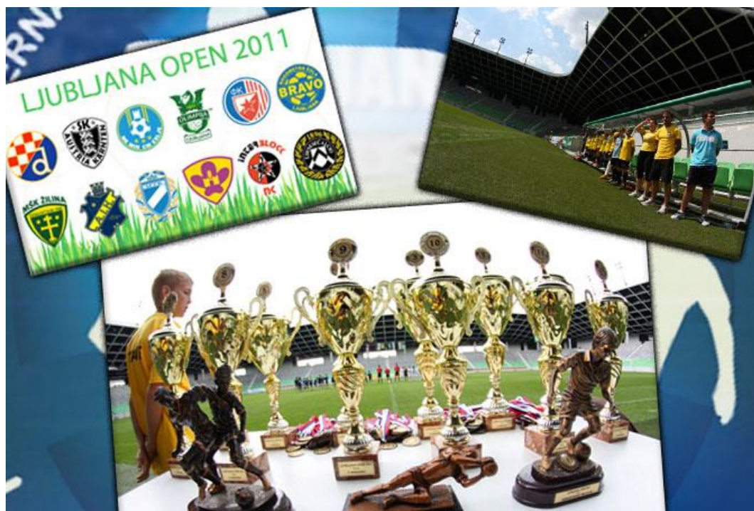
Vir: Spomini: Leta 2011 finale v Stožicah, 2016