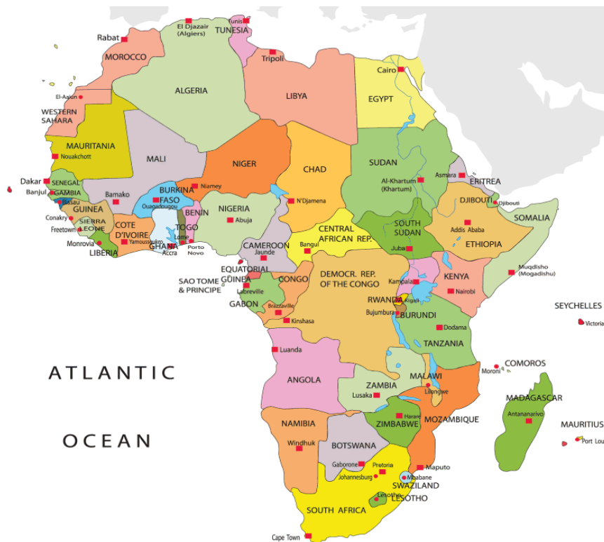
Slika 1: Zemljevid Afrike

Vir: Compare Infobase Ltd., Political map of Africa, 2015.