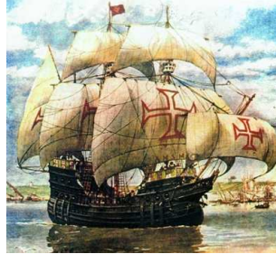
Slika 6: Templjarska ladja

Vojaška moč vitezov templjarjev jim je omogočala, da so razvili mogočno mrežo trgovskih poti med Evropo in Sveto deželo, prav tako pa so v trgovskih poslih dobro sodelovali z muslimani. V bistvu je bila templjarska mreža trgovin najbolj varna pot do Jeruzalema in iz Jeruzalema, saj so uporabljali izpiljen način pisnega prenosa denarja na vzhod (Renaissance Magazine, 1996).