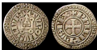
Slika 5: Kovanci vitezov templjarjev